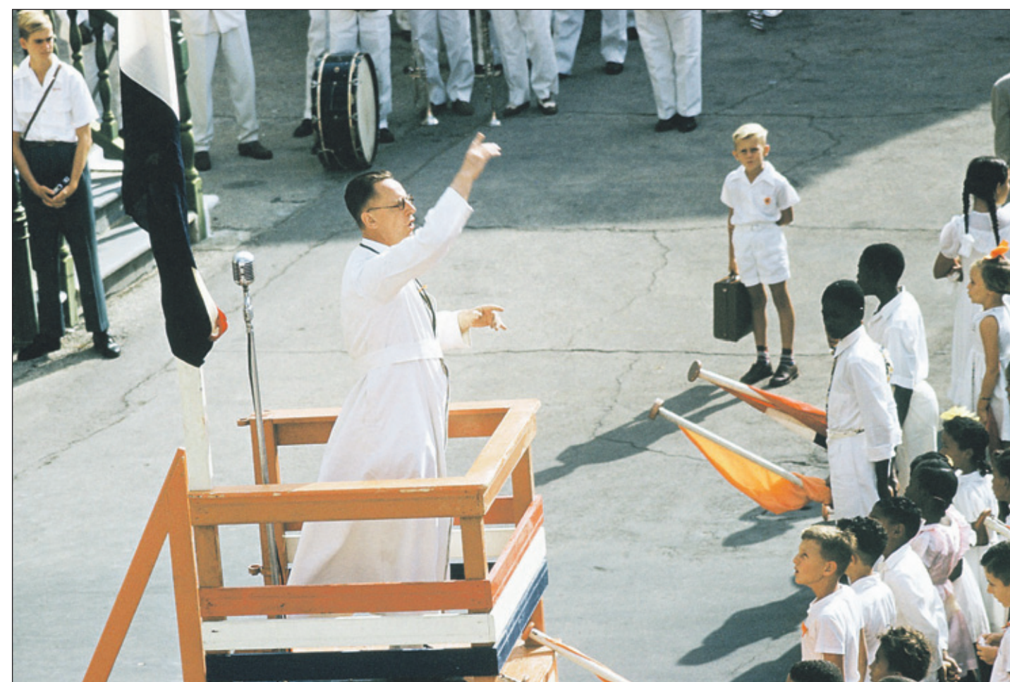
Een prediker moet niet voorkauwen.