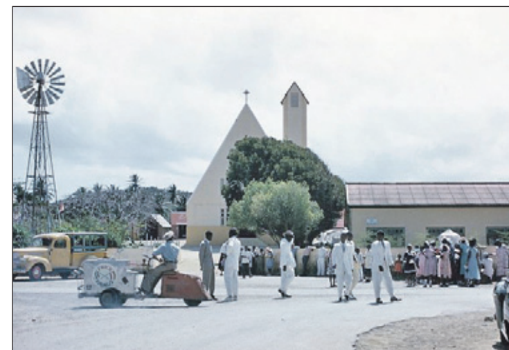
„Maar ik ben niet van deze kerk en preek hier nooit.”