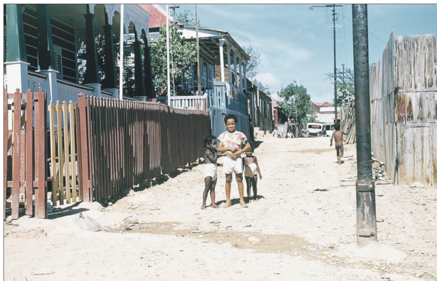
„De straat is voor mij apostolaat.”