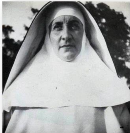
Foto genomen door haar broer Bram in Bilthoven ma haar voorlopige in vrijheidstelling op 15 augustus 1942.